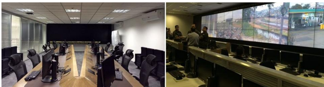
Figura 1. CICC em Recife.

A instalação do CICC em Recife para a Copa do Mundo contou com instalação de 1.500 câmeras em vias públicas e 10.000 em edifícios, sendo o segundo do país em proporções físicas (Batista, 2013). A Figura 1 mostra dois dos espaços do CICC de Recife.