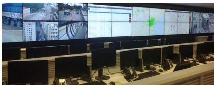
Figura 4. Salas de Monitoramento do CICC Curitiba. Acima a sala principal e abaixo uma das salas de reunião.